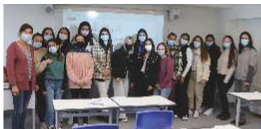
Centro educativo Ribamar (Sevilla)