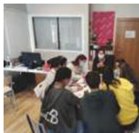
Centro Social Prodean